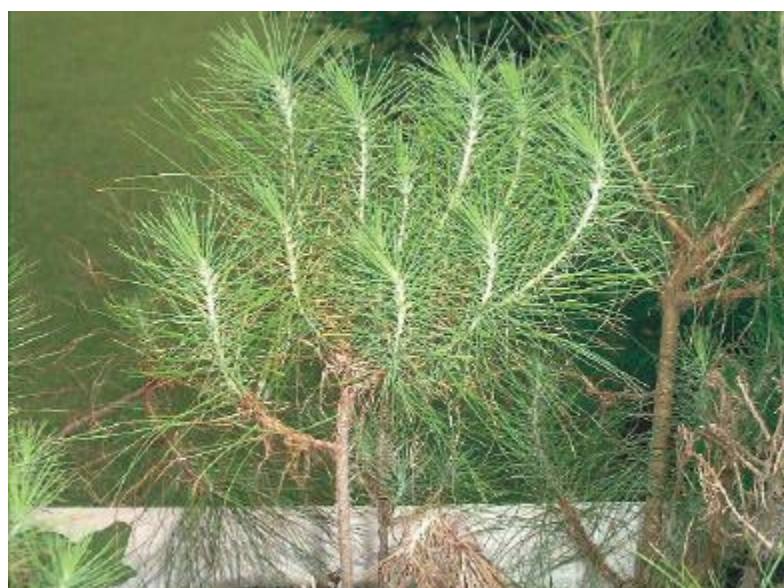
Figura 1. A- Minitouça na fase de produção

Os resultados deste pioneirismo são comprovados atualmente no Mato Grosso do Sul, onde a empresa potencializa florestas com produtividade de 40 m 3 /ha/ano, o que supera em 40% as florestas formadas a partir de mudas obtidas por sementes (Cavacos, International Paper, n. 389, www.ipef.br, 02/08/2001).