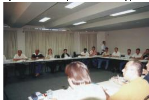
Participantes do curso

Além das palestras ministradas pelos professores convidados, também foram tratados os seguintes assuntos: Funções, absorção, transporte e redistribuição dos nutrientes; Biomassa e conteúdo dos nutrientes nas diferentes partes da planta; Exportação dos nutrientes pela colheita; Diagnose visual: descrição dos sintomas das deficiências e fitotoxicidades dos nutrientes; Diagnose foliar: faixas