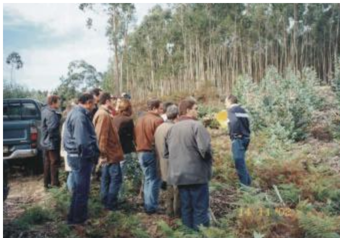
Visita aos plantios de 6 meses de idade de E. globulus .

O Curso de Nutrição e Adubação de Eucalyptus da RR Agroflorestal vem sendo realizado com sucesso em diversas empresas brasileiras e já teve a participação de mais de 100 profissionais da área florestal. O conteúdo inovador e a objetividade deste curso também estão atraindo empresas estrangeiras como a CELBI, localizada em Óbidos, Portugal, filiada a uma das maiores companhias de Papel e Celulose do mundo, a STORAENSO.