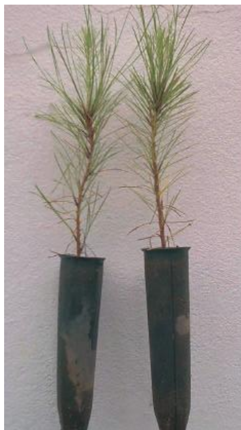
Figura 1. D - Mudanças na fase de expedição com 150 dias de idade.