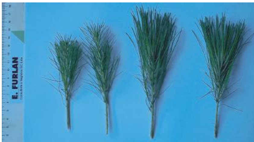
Figura 1. B - Padrão das miniestacas estacas utilizadas.

O período de coleta das miniestacas é quinzenal com tamanho entre 8 e 12 cm (Figura 1B). As miniestacas são plantadas em tubetes com uma mistura de substrato comercial Bioplant®, vermiculita e casca de arroz carbonizada. O tempo de permanência na casa de vegetação com sistema de nebulização é de até 120 dias, sendo que as primeiras raízes estão bem formadas após 40 dias (Figura 1C). Testes com uso de AIB indicaram que não existe necessidade de sua utilização. Mudanças com 120 a 150 dias de idade estão em condições de plantio no campo (Figura 1D), embora o aspecto seja muito diferente das produzidas por sementes, seguindo o padrão de mudas de eucalipto.