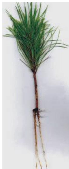
Figura 1. C - Muda enraizada com 40 dias de idade.

Weber, J. & Stelzer, H. Operational Rooted Cuttings in Southern Pines. Western Forest and Conservation Nursery Association Conference. Proceedings, 2000. Wendling, I., Xavier, A. Gradiente de maturação e rejuvenescimento aplicado em espécies florestais. Floresta e Ambiente. V. 8. n. 1. 2001. 187-194 p.