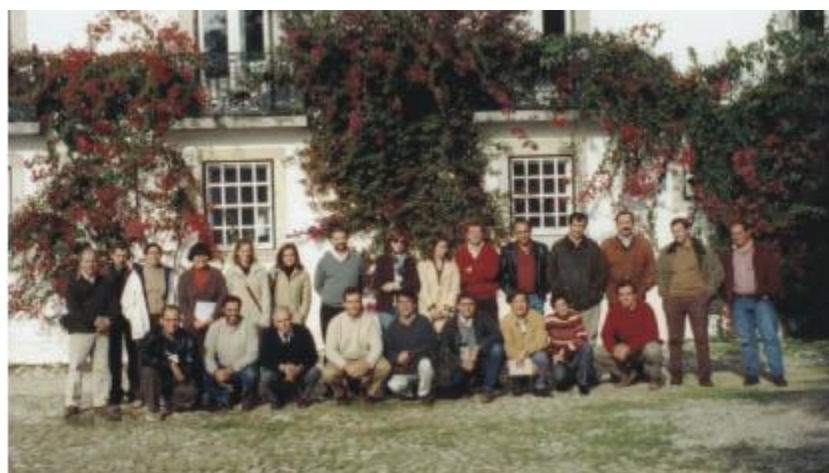
Participantes do curso de Nutrição de Eucalyptus na Quinta do Furadouro, Celbi/ Stora Enso, Portugal.

Este viveiro foi desenvolvido principalmente para possibilitar a concretização do programa da Stora Celbi de melhoramento genético do Eucalyptus globulus . Atualmente, a Viveiro do Furadouro é uma empresa autônoma, que produz 8 milhões de plantas por ano, certificadas segundo as normas em vigor, sendo que 20% desta produção destina-se à Stora Celbi. A Stora Celbi produz plantas florestais à mais de 30 anos e dispõe atualmente de plantas de Eucalyptus globulus cuja qualidade genética é conhecida mundialmente.